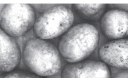
Culture des calories