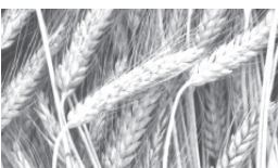
Culture du carbone