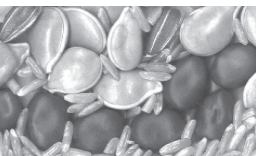
Graines à pollinisation libre