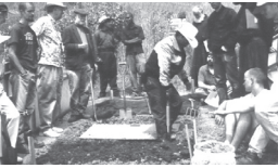
Préparation profonde du sol