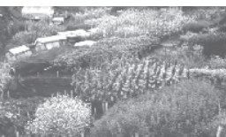
Méthode de jardinage complète